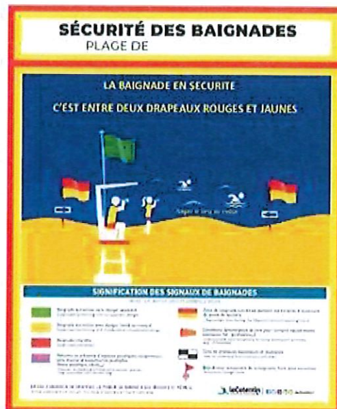
Rappel à afficher chaise de surveillance

Zone de pratique des activités aquatiques et/ou nautiques : non.